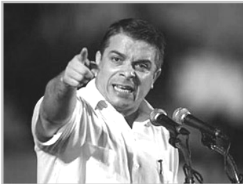
Felipe Pérez Roque

Často je kritizován politický systém na Kubě a svoboda slova. Kubánská vláda namítá, že občané mají možnost účastnit se vlády své země. Jedna strana, podle jejich názoru, občany sjednocuje a chrání před rozdělením. Kuba také, podle argumentů kubánské strany, nikoho netrestá