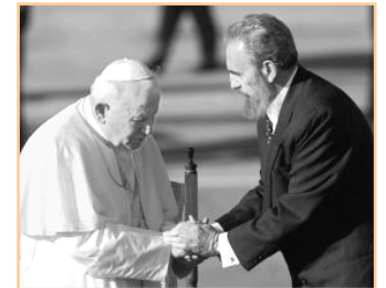
Jan Pavel II. v roce 1998 na Kubě

Po revoluci v roce 1959 byla Kuba prohlášena za ateistický stát. Majetek církví byl znárodněn a církevní školy byly zavřeny. Zakázáno bylo také vyučování náboženství na státních školách a náboženská procesí. Velká část kněží ze zahraničí odešla nebo byla vypovězena ze země – odhaduje se, že asi 8 % z nich za kontrarevoluční činnost. Před rokem 1959 bylo na Kubě cca 700 kněží, v roce 1988 už jich bylo méně než 225. Církvím bylo zakázáno využívat k bohoslužbám