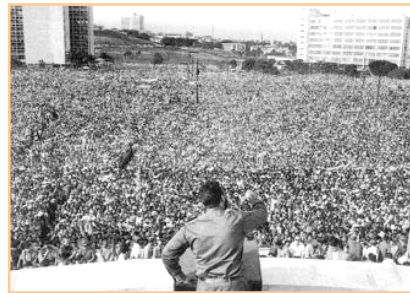
Castrův projev pro statisícový dav

Realita je ovšem trochu jiná. 2. ledna roku 1959 se vlády, po úspěšné revoluci a odstoupení prezidenta Rubéna Fulgencia Batisty y Zaldívaru, ujal Fidel Alejandro Castro Ruz. Prezidentem se stal Manuel Urrutia Lleó a premiérem José Miró Cardona. Fidel Castro se stal premiérem 16. 2. 1959. Manuel Urrutia rezignoval 17. července roku 1959 a 18. července 1959 se prezidentem stal Osvaldo Dorticós Torrado, premiérem opět Fidel Castro. Nejvyšším představitelem státu, tj. prezidentem Státní rady, je od 3. prosince roku 1976. První volby do Národního shromáždění lidové moci ( La Asamblea Nacional del Poder Popular ) se konaly poprvé až v červenci roku 1976. Do té doby vládní struktury svoji moc odvozovaly