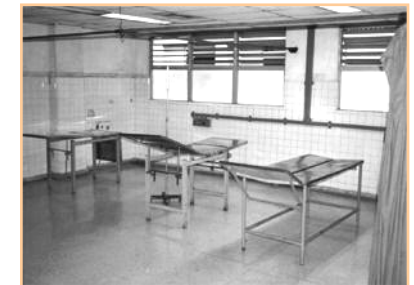
pohotovost v nemocnici pro Kubánce

Další represe přišly na začátku 90. let, kdy se zvýšila informovanost o AIDS, a na nařízení oficiálních míst byli homosexuálové zavřeni do speciálních sanatorií. Ale protože toto opatření bylo příliš drahé, kubánská politika proti homosexuálům se zmírnila. Až v roce 1992 prezident Fidel Castro prohlásil, že homosexualita je „přirozená lidská tendence, která musí být respektována“. Nikdy se ale za svá předchozí prohlášení a perzekuci homosexuálů neomluvil.