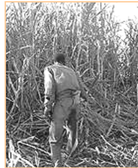
„dobrovolná“ práce při sklizni cukrové třtiny

I v současné době vysílá kubánská vláda zaměstnance, kteří jsou loajální k vládě, do zahraničí, kde pracují jako nájemní dělníci. Výše platu těchto zaměstnanců je sjednávána mezi vládou a danou společností a zaměstnanec ji nemůže ovlivnit. Mzda je v amerických dolarech vyplácena kubánské vládě, která zaměstnanci vyplácí stejnou hodnotu, ale v kubánských peso. Výsledkem je zabavení cca 95 % výdělku. Zaměstnanci těchto společností nemohou vytvářet žádná