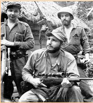
Barbudos (vousáči) – zleva: Raul Castro, Fidel Castro a Camilo Cienfuegos

Další represe spojené s tvrdým postupem proti odpůrcům režimu přišly 90. letech a trvají prakticky dodnes.