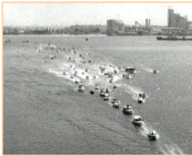
Útěk z přístavu Mariel

V průběhu své vlády Fidel Castro několikrát dovolil lidem opustit zemi bez jakýchkoli omezení. Bylo to například v roce 1965 přesněji 28. září, kdy prohlásil, že účast na revoluci je dobrovolná a Kubánci žijící na Floridě si mohli přijet pro své příbuzné do přístavu Marioca. Lidé mohli opustit zemi až po té, co odevzdali všechny cennosti a šperky a zanechali na Kubě prakticky celý svůj majetek. Omezení