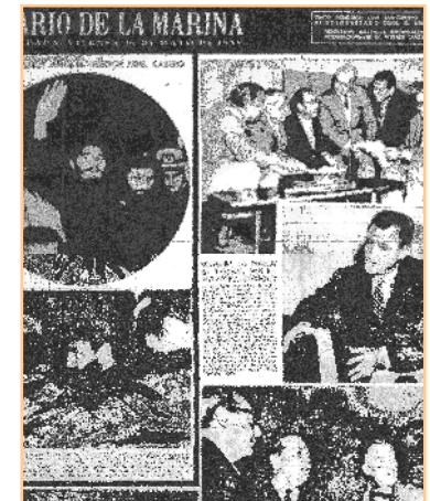
Diario de la Marina, 1. května 1959

Omezený je i přístup k internetu. Některé internetové stránky, především opozice z Miami, nelze na počítačích otevřít. V roce 2004 vstoupil v platnost zákon, který umožňuje přístup na internet pouze vybraným firmám. Také provozovatelům knihoven hrozí vězení, jestliže půjčují knihy, které jsou zakázány jako například Farma zvířat George Orwela nebo knihy Milana Kundery.