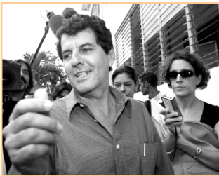
Oswaldo Payá Sardiñas

Opozice se začala spojovat až v polovině 90. let, kdy v roce 1995 vznikla Kubánská rada ( Concilio Cubano ), která sdružovala 140 opozičních skupin. Další iniciativou, která sjednotila disidentská uskupení, bylo v roce 1999 hnutí Všichni jednotní ( Todos Unidos ). V roce 2002 podpořila tato skupina Projekt Varela Křesťanského hnutí osvobození ( Movimiento Cristiano Liberación ), jehož prezidentem je Oswaldo Payá Sardiñas. Projekt Varela požaduje vypisání referenda o změně nedemokratických zákonů a propuštění politických vězňů. Petice byla v květnu roku 2002 předložena Národnímu shromáždění lidové moci, které na to reagovalo schválením zákona o neodvolatelnosti socialistického charakteru státního zřízení. 18. března 2003 bylo zatčeno 75 disidentů a odsouzeno k trestu odnětí svobody na 6–27 let, 43 z nich se snažilo sbírat podpisy pro Projekt Varela. Petici už podepsalo více než 25 000 osob. V průběhu roku 2004 a na začátku roku 2005 bylo 19 těchto „vězňů svědomí“ propuštěno ze zdravotních důvodů.