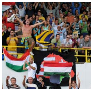
fotbalový zápas slovenské ligy DAC 1904 Dunajská Streda – Spartak Trnava