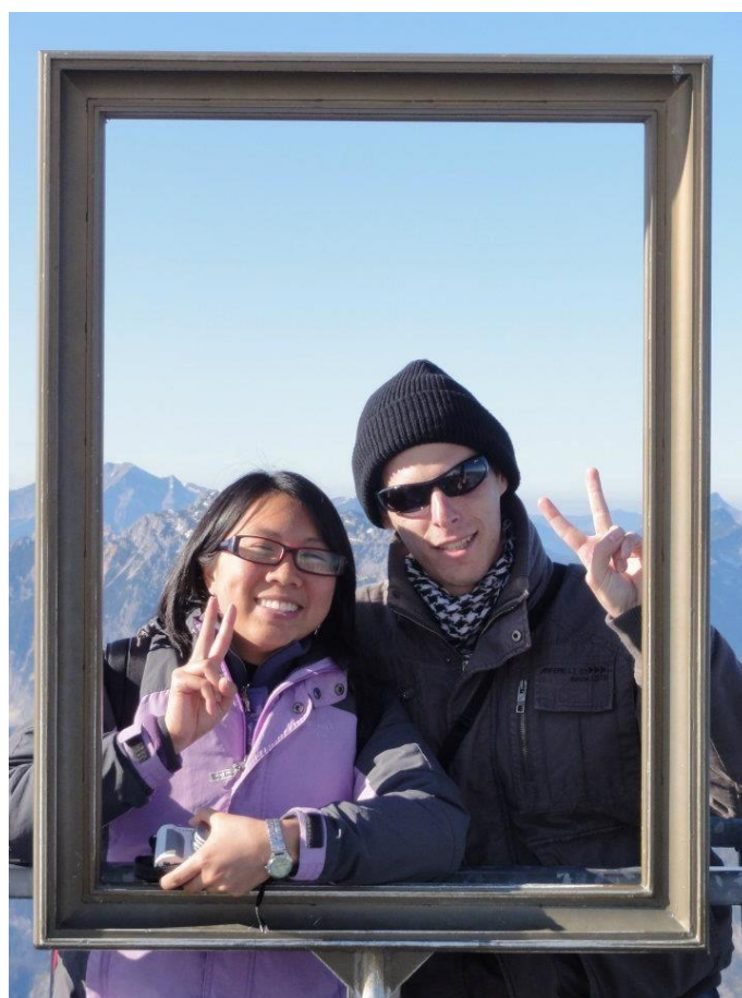
Po Erasmu budete mít přátele po celém světě – třeba i v Hongkongu