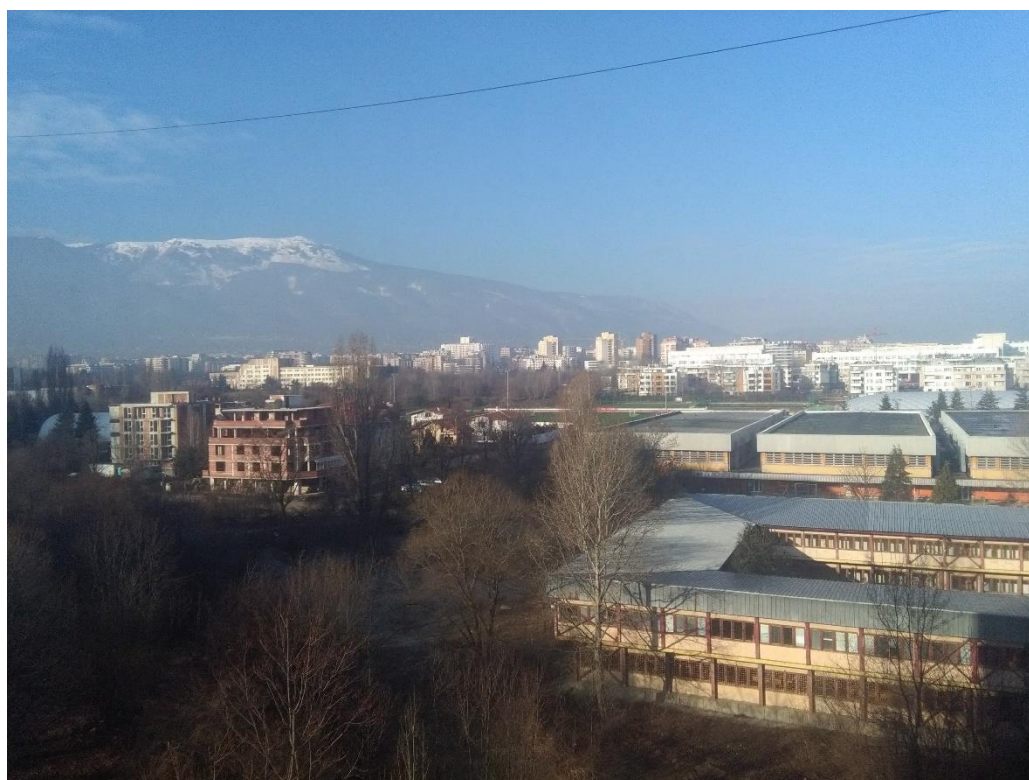
Výhled z okna pokoje na koleji v Sofii (únor 2018)