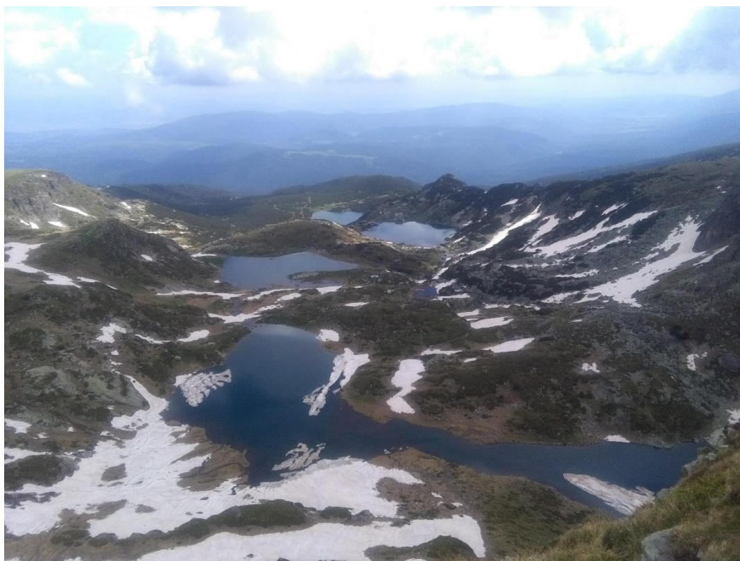
Sedm rílských jezer v pohoří Rila (červen 2018)

Celkově mohu napsat, že Bulharsko je českými studenty často neprávem opomíjeno, ačkoliv nízké životní náklady, pohodové, ale přínosné studium, a hlavně jedinečná atmosféra Balkánu, by měly a snad i do budoucna budou, lákat stále víc a víc studentů.