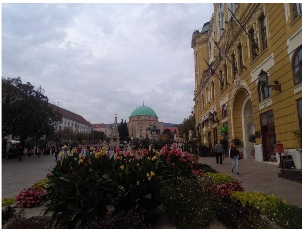
Hlavní náměstí (Széchenyi tér) v Pécsi – říjen 2018

Největší problém pro mě osobně bylo složité papírování a kontakty s úředníky, kteří, až na výjimky, jsou často nerudní, nechápaví a hlavně zásadně nekompetentní. Pokud bych měl naopak vyzdvihnout světlé stránky, tak bezesporu Pécs je krásné historické město s řadou jedinečných zákoutí, různorodými čtvrtěmi a zajímavým přírodním okolím v podobě hustě zalesněného pohoří Mécsek. Navíc celé město město je velmi poklidné, bezpečné a člověk pomalu přivyká i tak exotickému jazyku, jakým je maďarština.