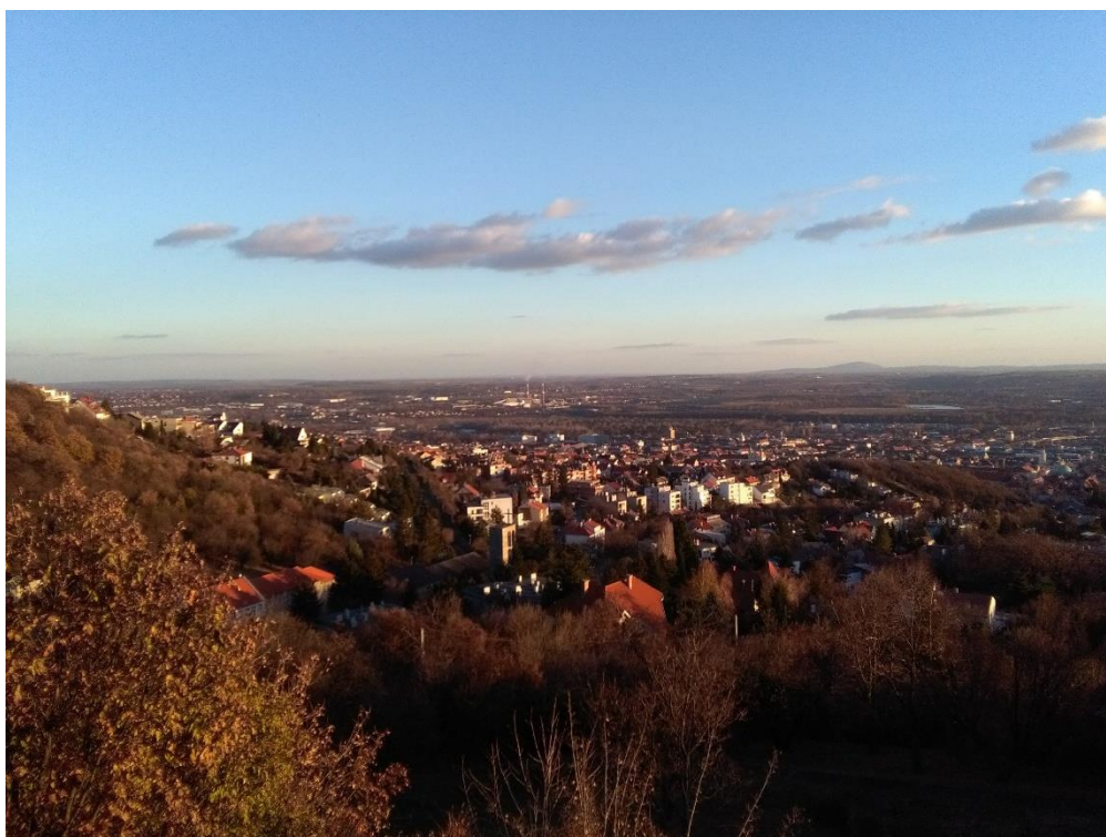
Západ slunce nad Pécsí – prosinec 2018